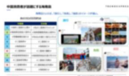
SNSでみる消費者の海南島免税に対する意識