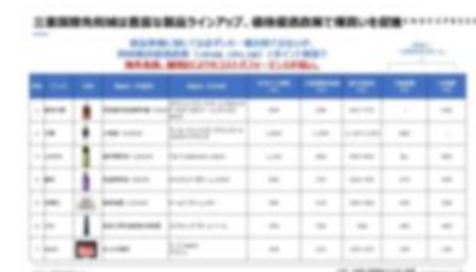
海南島免税人気製品SNS評判