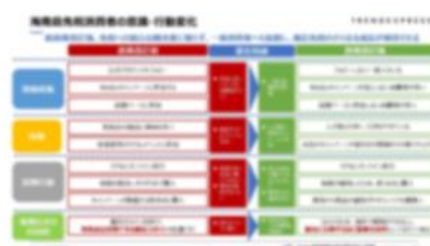
海南島免税施策後の消費者購買の変化