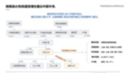
海南島免税の流通の仕組み紹介