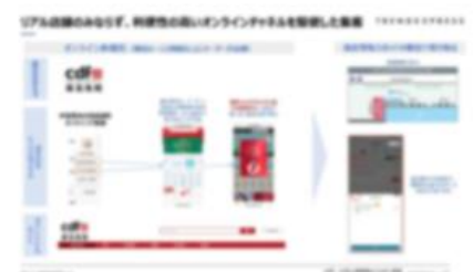
海南島免税プロモーション事例